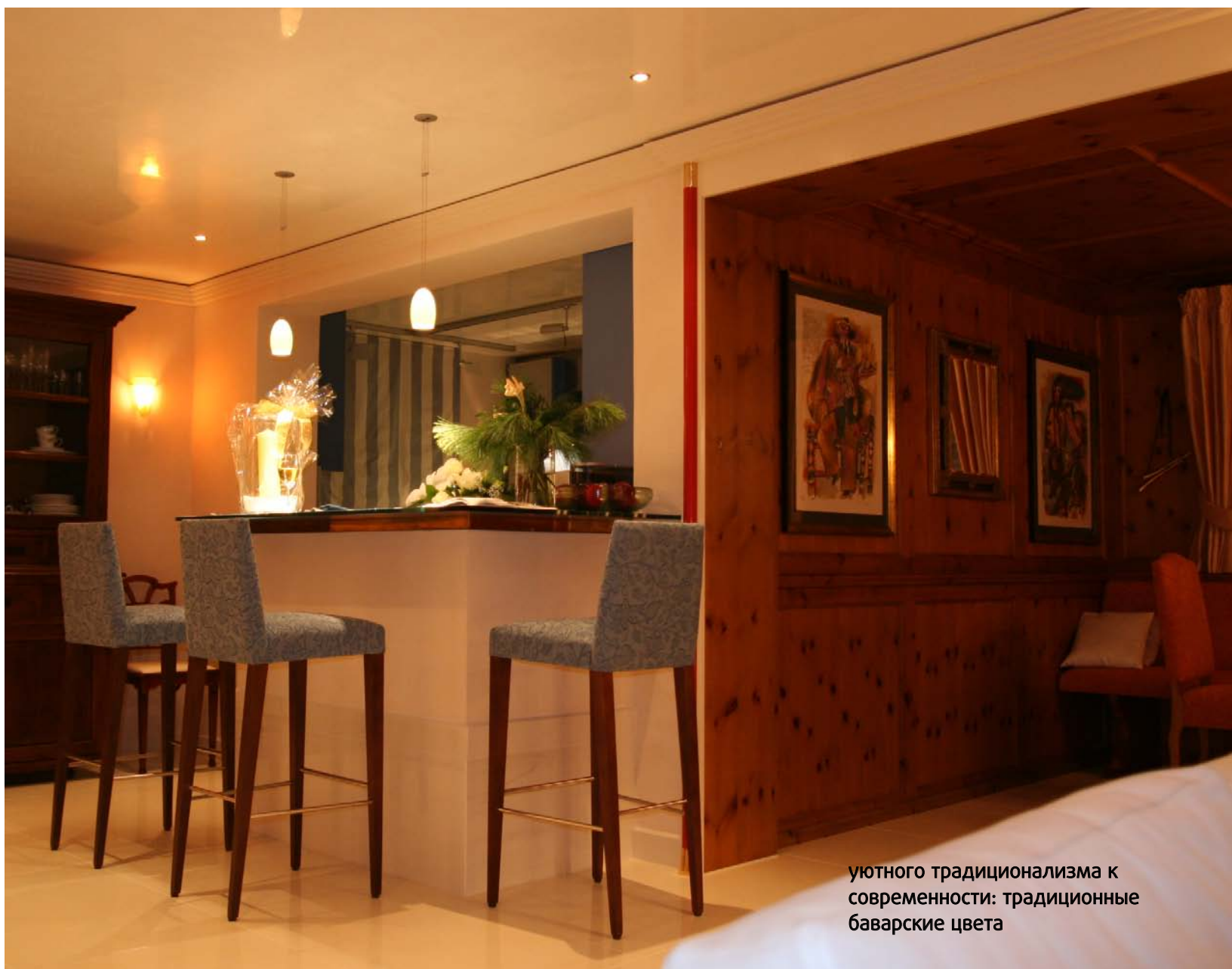
уютного традиционализма к современности: традиционные баварские цвета