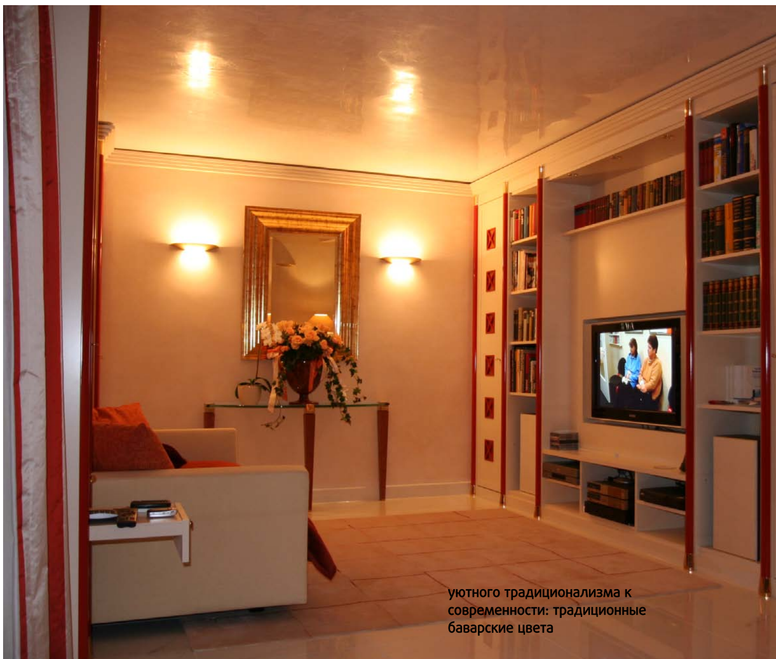
уютного традиционализма к современности: традиционные баварские цвета

Объект — пентхаус площадью 250 м 2 Проектирование — «Benecke interior design» Строительная (отделочная) организация — «Schautz Einrichtungen»